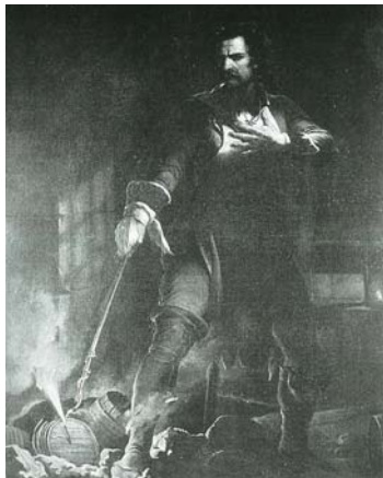
図版13 ジュリオ・ピアッティ 《ピエトロ・ミッカ》1842年