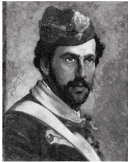
図版4 松岡壽《ピエトロ・ミカの服装の男》1881年