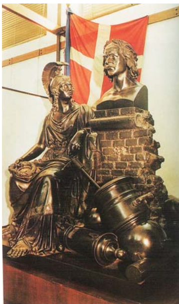
図版8 ジュゼッペ・ボリアーニ 《ピエトロ・ミッカ記念の像》 1837年