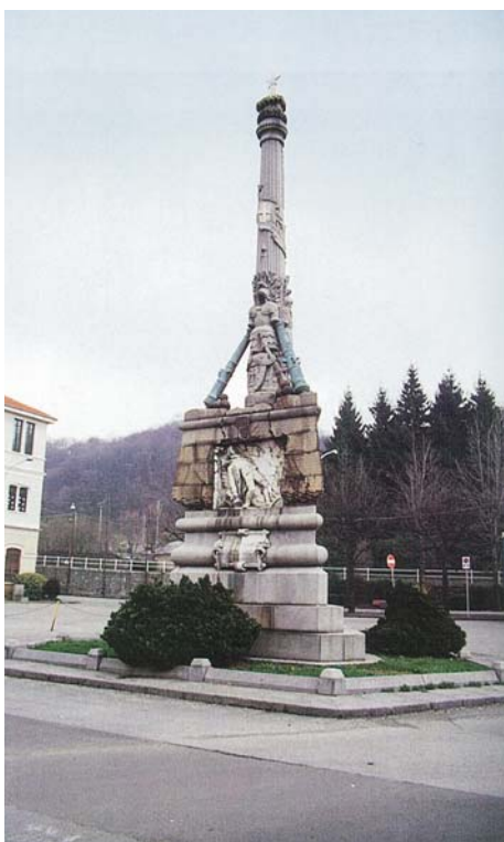
図版10 ジュゼッペ・マッフェイ 《ピエトロ・ミッカ記念碑》1880年 サリアーノ, ピエトロ・ミッカ広場