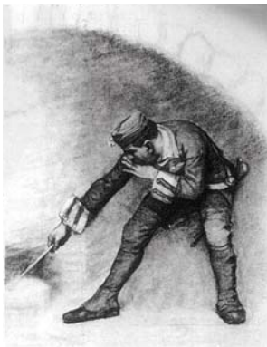
図版2 百武兼行《ピエトロ・ミッカ図下絵》1881~82年