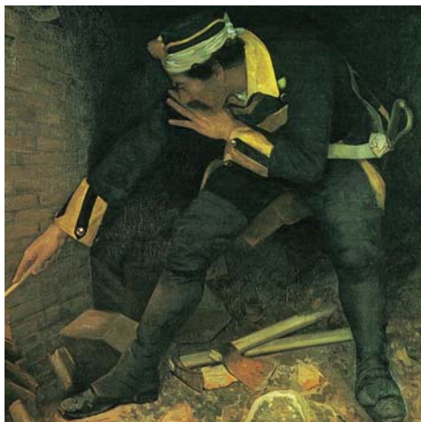
図版15 百武兼行《ピエトロ・ミッカ図》部分