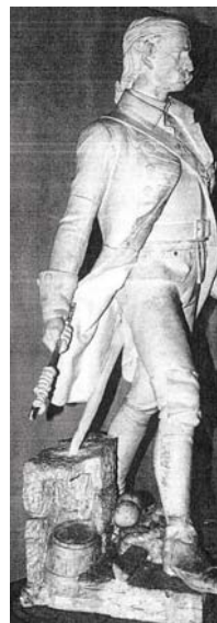
図版16 カッサーノ 《ピエトロ・ミッカ》1864年 石膏型