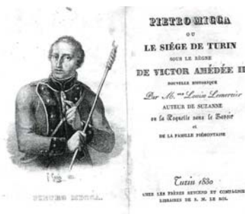
左：図版7 フランチェスコ・ゴニン《ピエトロ・ミッカあるいはトリノ包囲》1831年