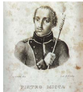
上：図版6 アンジェロ・カピザーニ《ピエトロ・ミッカ》1829年