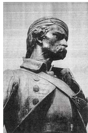
図版9 ジュゼッペ・カッサーノ 《ピエトロ・ミッカ》 1864年, トリノ