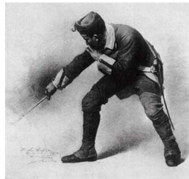
図版3 松岡壽《ピエトロ・ミッカ図下絵》1881~82年