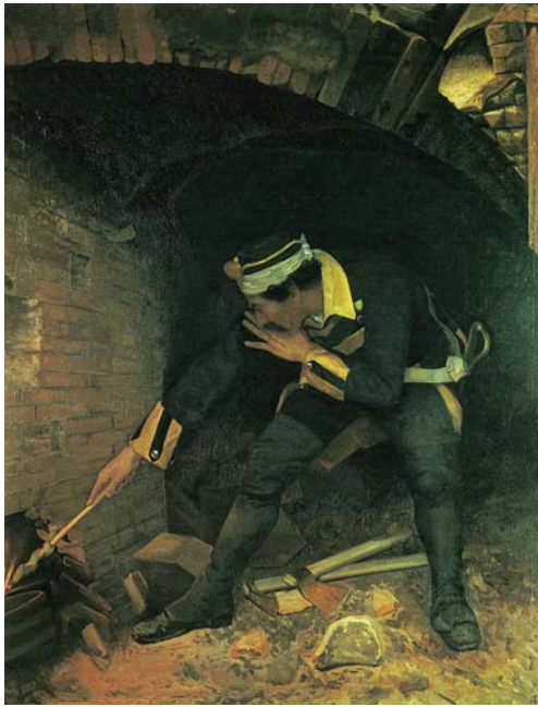
図版1 百武兼行《ピエトロ・ミッカ図》1882年