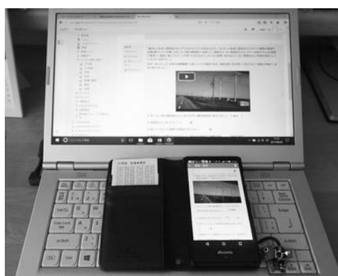
図6 同じ問題をみたPCとスマートフォン