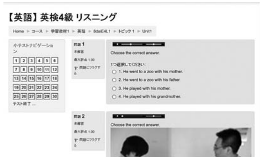
図4 eラーニング共通基盤の教材例

とができる。さらに大きな利点として、各大学は豊富な共有教材群を用いて自由に学習コースを設計することが可能である。Solomon版はクラウド上で一体管理するため、利用大学はLMSサーバ等を個別に用意する必要はない。