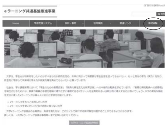
図3 eラーニング共通基盤推進事業

これらは、2つのシステムで同じ教材が利用可能である。Moodle 版は、各大学の Moodle サーバに利用教材をバックアップして利用するため、各大学で学習者のデータ管理を行うこ