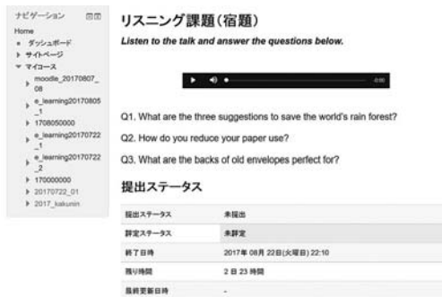
図9 作成したリスニング課題例