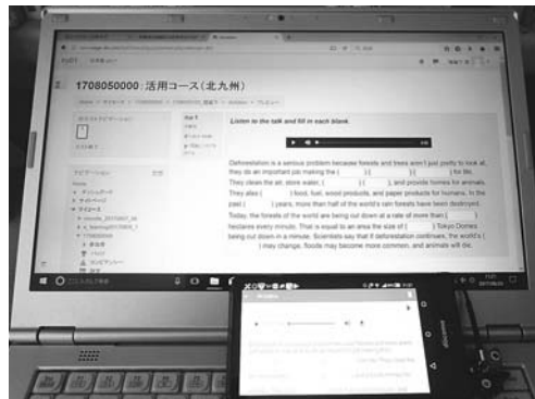
図8 作成した小テスト (dictation) の PC 画面とスマートフォンの画面との比較

* 授業時（特にライティング主体の場合）および自宅では PC ブラウザ版、授業外の「すきま時間」または動画・音声視聴主体の個別学習では Moodle Mobile をそれぞれ補完的に使い分けることが望ましい。