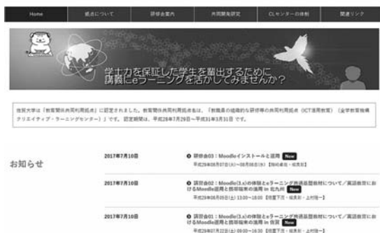
図1 ICT活用教育の共同利用拠点の講習・研修の案内

の教育関係者である。研修時間は、6時間のFD/SDプログラムで実施した（図1）。また、内容は①ICT活用教育の共同利用拠点や②eラーニング共通基盤教材を紹介したあと、③Moodle(3.x)に学生権限でログインしてLMSの多くの機能を体験し、④Moodle(3.x)を教員権限で体験できるようにした。さらに、⑤英語教育におけるMoodle運用と携帯端末の活用について研修（デモ・体験）を実施した。