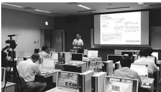
図10 研修会場の様子 (北九州学術研究都市 学術情報センター)

研修では、事前アンケートと事後アンケートを行った。アンケートの一部まとめた結果を図11に示す。参加者の大部分の大学における環境は、科目シラバスはオンライン上で管理され、メール以外にオンライン上で学生に通知可能となり、授業評価調査も可能となっている。一方で、大学の情報センター等が Moodle の利用環境を提供しているとは限らない。Moodle